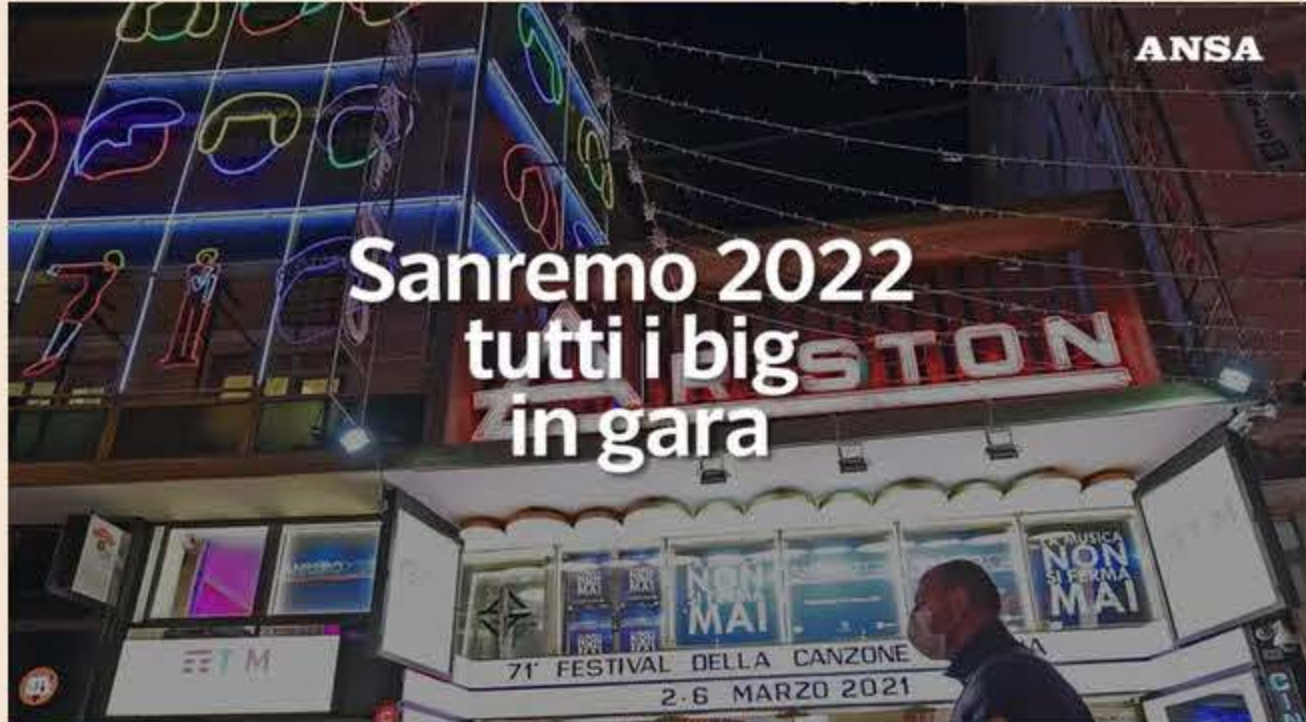
▲ Sanremo 2022, tutti i big in gara